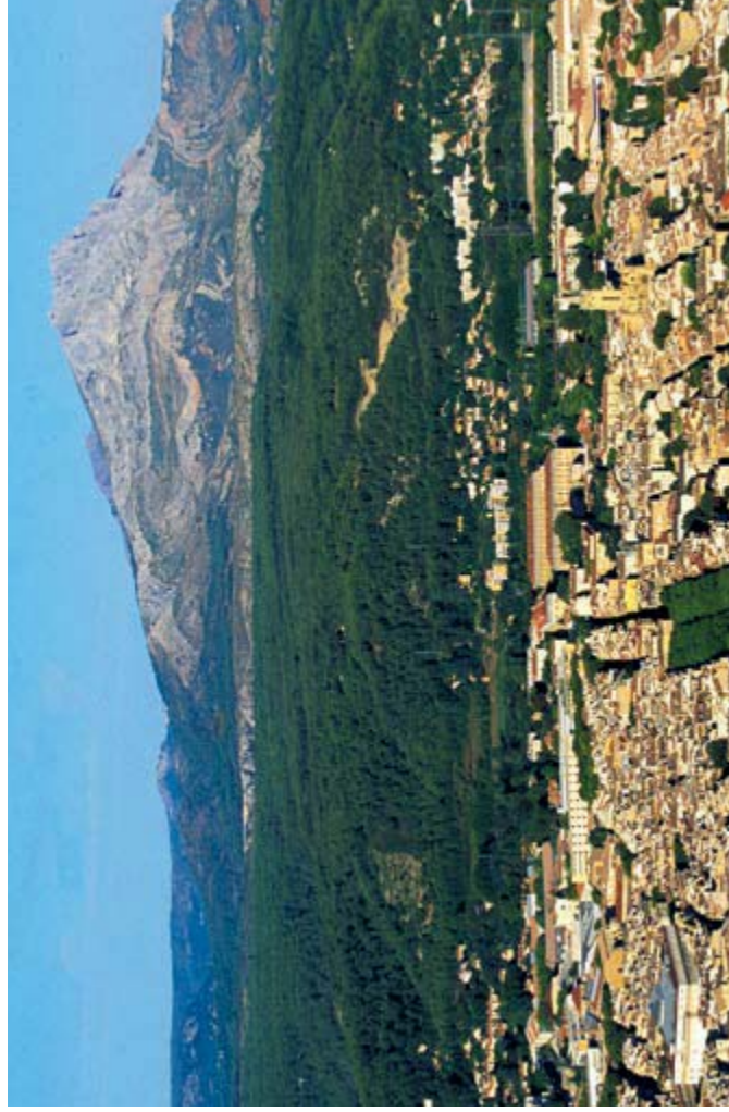
Agence ITER France - Avril 2021 - Document à ne pas jeter sur la voie publique - Informations non contractuelles

Contact : Laurence Claisse Ebbo - contact@the-provence.com